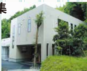
▲正栄会地域交流ボランティアセンター