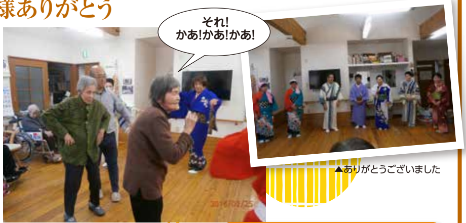
▲ありがとうございました

なでしこ会の皆様 が踊りの披露に来て くださいました。最後 は職員、入居者の みなさまも輪に加わ り楽しく踊りました。 いつもは車イスを使 われる方も精一杯踊 っていました。また いらしてくださいね!