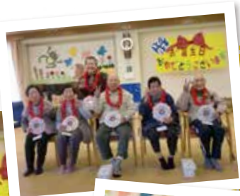
◀◀笑顔で記念撮影を行いました

市来にある観音ヶ池にお花見に行きました。葉桜になり満開ではありませんでしたが、たくさんの桜の木に囲まれ、皆様、「きもちいいね」と喜ばれていました。来年は満開の桜の下でお花見を楽しみましょう。