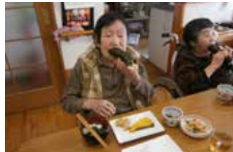
▲その後は小さく切ります!