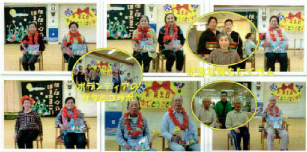
記念写真もたくさん

たくさんのボランティアの方々や同じく通っていただいている利用者による踊りや演奏等で華やかに、4・5・6月生まれの方々の誕生を祝っていただきました。