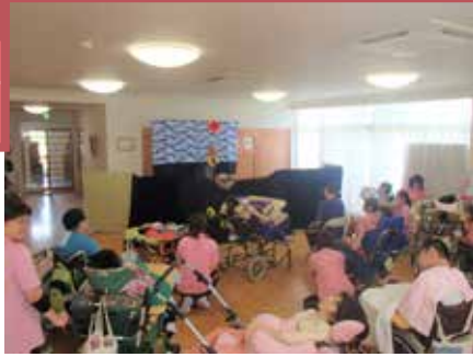
▲「三匹の子豚」を鑑賞中♪

新しくできた伊集院のセイカ工場に行ってきました。工場を見学し大好きなアイスについて学んできました。最後はお土産を頂いて笑顔が多くみられました。また、9月に「人形劇団ピノキオ」の皆さんをお迎えし、素敵な人形劇を鑑賞して楽しい時間を過ごすことができました。