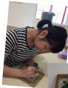
◀いつもの笑顔を忘れて集中!