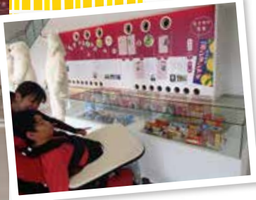
▼アイスについて学んでいます