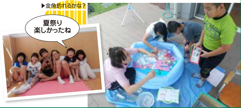
夏祭り楽しかったね