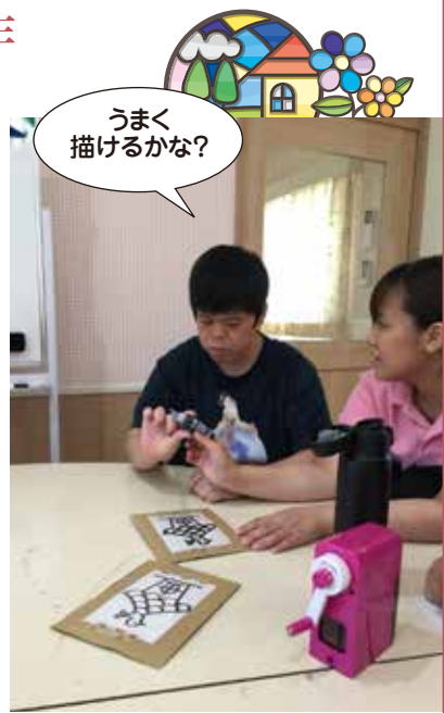
うまく描けるかな?

新しい活動としてスタンドグラス作りに取り組みました。フォトフレームのプラスチック板を利用して、ガラス絵具で色を付けました。それぞれの好みの色を自由に手に取り楽しみながら、個性豊かな作品に仕上がりました。今後も新しい絵柄に挑戦していく予定です。