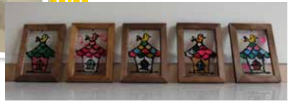
▼こんなに素敵な作品になりました