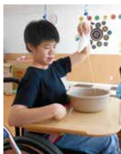
◀出来たよ☆どうかな?