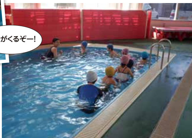
◀みんなで水中ウォーキング