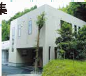
▲正栄会地域交流ボランティアセンター