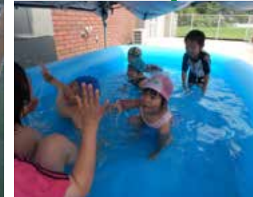
▼「お馬さん」からの先生にタッチ〜