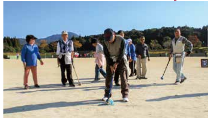
▲グラウンドゴルフ大会