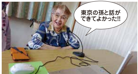
東京の孫と話ができてよかった!!

新型コロナウイルス感染症の拡大に伴い、Zoomを活用した面会を実施しております。また、入居希望の方も施設の雰囲気をスマホ・タブレットを通じて見ることができますので、ぜひホームまでお問い合わせください。