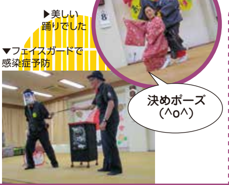
▶美しい踊りでした