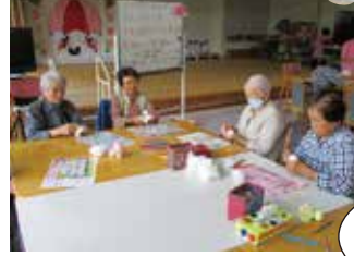
▲綿を詰め形を整えています