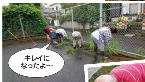
キレイになったよ～