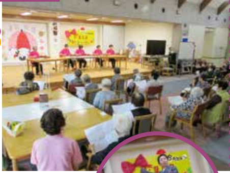
▼皆様演奏を聴き入っております!