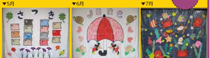
▼5月 元気いっぱい鯉のぼり ▼6月 雨にも負けず～相合傘～ ▼7月 シーパラダイス ※壁紙の大きさは、縦230cm・横250cmです。