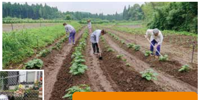
▼長雨で崩れたウネを戻しています

梅雨の長雨が続き、さつまい芋のウネが崩れたり、野菜の成長が遅いですが、長年の経験を活かし、出来ることをがんばっています。スーパーお年寄りのみなさんです。