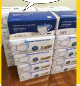
大切に使用させていただきます

「小平株式会社」様よりたくさんのマスクを寄贈していただきました。これからも地域のために頑張っていきます。