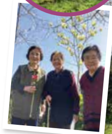
▲桜以外の花も満開