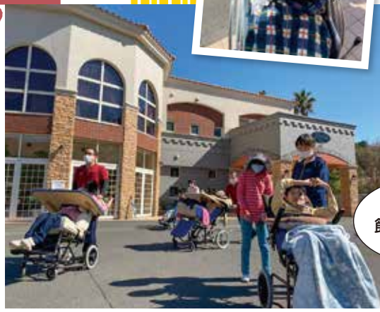
▼お散歩 きもちいい~

晴天に恵まれた暖かい日に、敷地内での散歩を楽しみました。短い時間でしたが、春を感じて幸せな気分を満喫できた一日となりました!