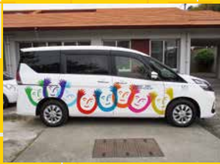
◀愛泉園デイサービスセンター 通所介護事業所

日本財団より助成金をいただき、車両を購入しました。多くの利用者の方へ充実したサービスを提供できますよう活用させていただきたいと思っております。