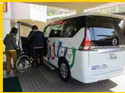
▶大切に使用させていただきます