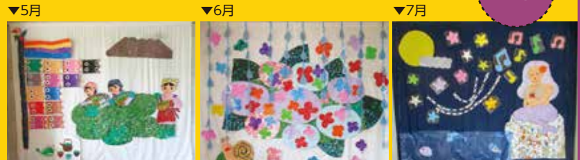
5月 茶摘み 6月 紫陽花 7月 マーメイド