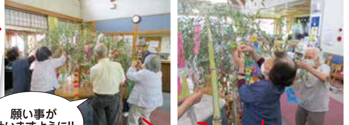
願い事が叶いますように!!