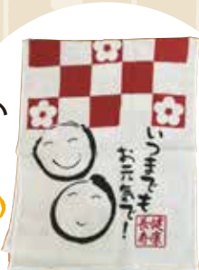
▲落ち着いた使いやすいタオルです