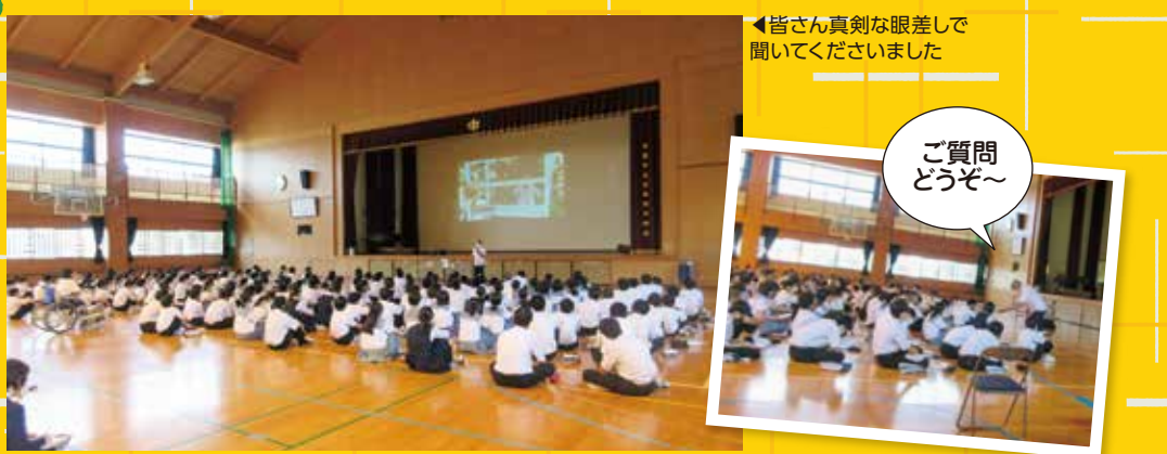
◀皆さん真剣な眼差しで聞いていただきました

県社会福祉協議会の依頼で未来の福祉人材確保を目的に講演をしました。内容は身近な問題を題材にして、福祉とは?認知症とは?尊厳とは何かについて一緒に考える時間を作りました。生徒のみなさんも真剣に聞いてくださり、一人でも医療・福祉・介護に興味を持っていただけるとありがたいです。