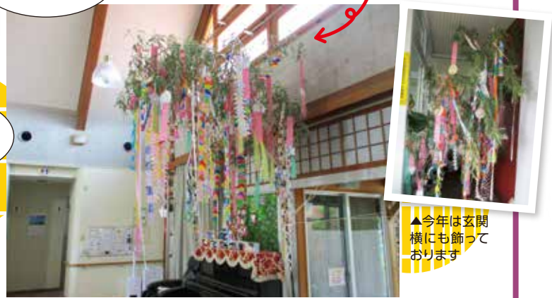
▲館内の笹は長さ約5メートル!!