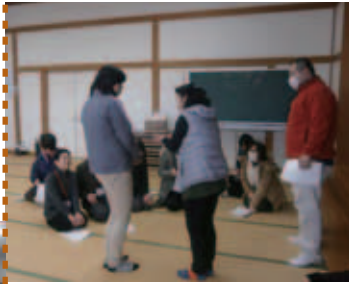
▲皆さん真剣に取り組んでいました