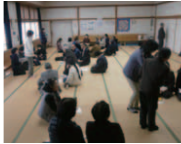
▲ご協力ありがとうございました