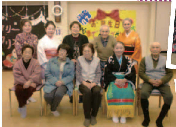
▲一緒に写真を撮りました

10月、11月、12月生まれの方々の誕生会を開催しました。ボランティアによるお祝いを兼ねた踊りや歌、マジックショーなどを披露して頂き、誕生者の方々だけではなく、他の利用者の方々も楽しまれていました。