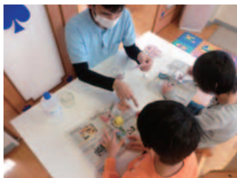
▲スノードーム作り

クリスマス製作で、スノードーム作りを行いました。初挑戦ということもあり、ビンの中に入れるマスコット作りでは、大きさやバランスを考え、イメージして作ることが難しかったようで苦戦する姿もありました。最後まで諦めず完成させることができ、出来上がった作品を手に「きれい♪」と言いながら、嬉しそうにお友達と見せ合いっこをする姿がとても印象的でした。