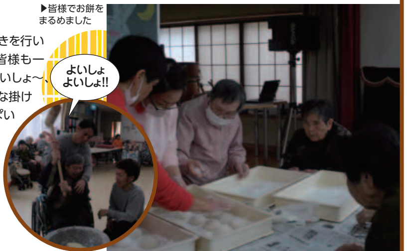
よいしょ よいしょ!!

12月27日、餅つきを行いました。利用者の皆様と一緒に餅をつき、「よいしょ〜、よいしょ〜」と大きな掛け声とともに力いっぱい杵を振り下ろしていらっしゃいました。ついたお餅は、皆様慣れた手つきで丸めてくださり、鏡もちやイモ餅を作りました。