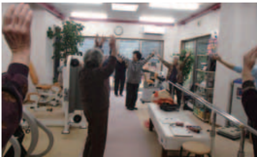
▲転倒ストップ教室では曲に合わせた体操もしています!

転倒ストップ教室は、毎月一回、地域の方々と一緒に楽しく開催しています。マシンでの体づくりや曲に合わせた体操、認知症予防にも繋がるレクリエーションなど楽しく運動をしています。次回の開催日は2月18日、3月5日です。ふれあい教室も公民館単位で開催していますので、どちらともお気軽にご連絡くださいませ。