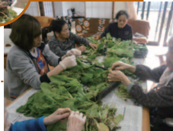
▲いろんな野菜をこしらえ

1月9日に郡山地区民生委員の皆様と、認知症対応のコミュニケーション学習を行いました。民生委員・包括支援センター・地域のグループホームがお互いに協力し学びが多い研修となりました。当グループホームの職員も、認知症の方役として大活躍でした。