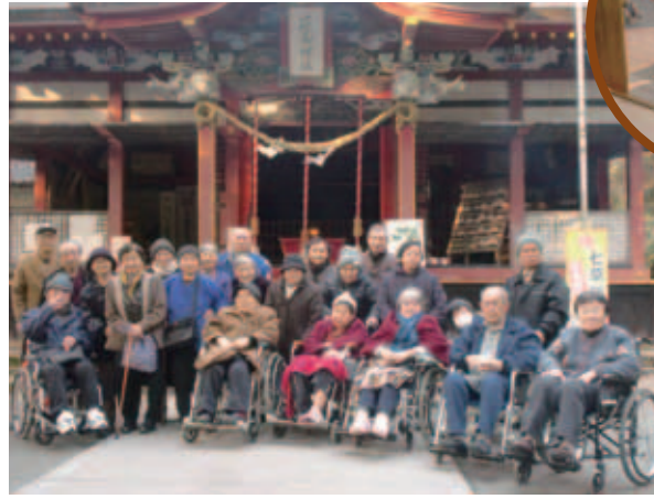
▲みんなで「はい、ポーズ!!!」

今回、草牟田の護国神社、郡山の花尾神社に初詣に出掛けました。護国神社ではお参りをされた後、振る舞い酒を楽しみ、獅子舞の奉納を目の前で堪能、獅子に噛まれると福が来るということで皆様手を差し伸べ、噛んでもらい大満足されたようです。花尾神社では急ぎ足のお参りとなりましたが、皆様どんな事をお願いされましたか？