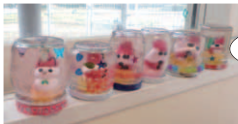
▲きれいに出来ました!!