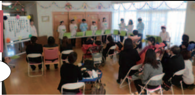
▲新成人の会の様子