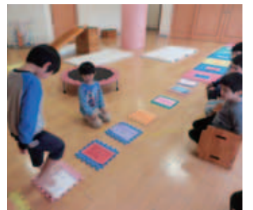
▲～すごろく～何のお題かな～?