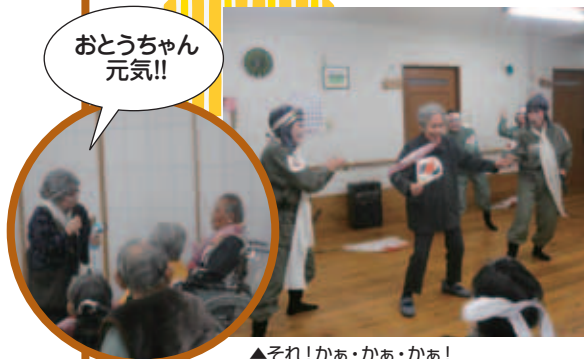
おとうちゃん 元気!!

皆与志踊りの会の皆様がグループホームに来てくださり、ユーモアあふれる舞踊を披露してくださいました。入居者の皆様は大声で笑ったり、踊りに参加したりと大変楽しい時間を過ごしました。また、遊びに来てくださいね!!