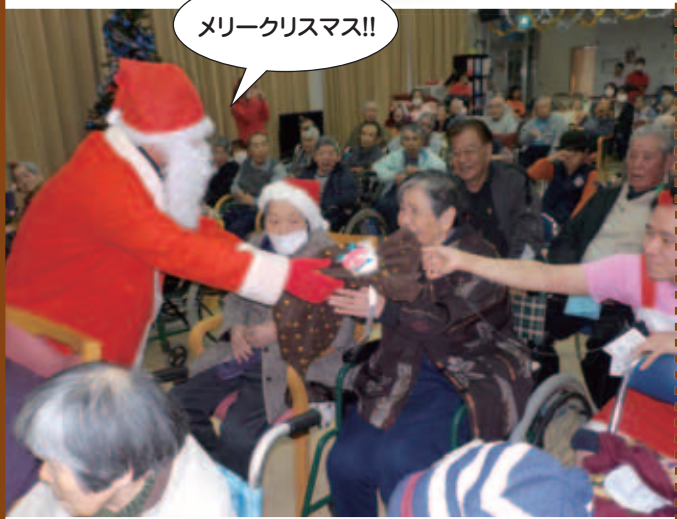
メリークリスマス!!