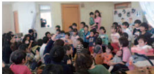
▲～全員合唱～「手をたたこう」