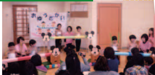
▲年中～筒太鼓～セイヤーッ!!