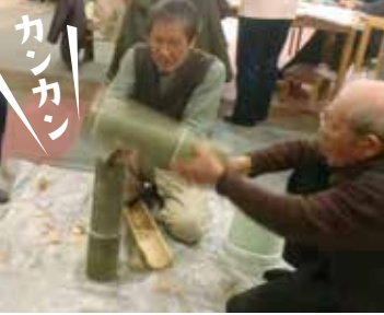
▲好きな分野での真剣な表情