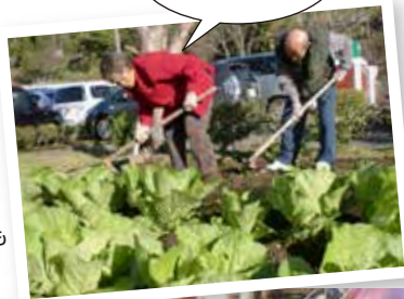
▶自家農園も あります

年末年始はここに収まりきれないほどたくさんの行事がありました。一人ひとりの特技や趣味等を活かし、分担しながら参加いただくことで、たくさんの素敵な作品と笑顔で満ち溢れました。今年も皆様にとってより楽しく、幸せな一年となりますように職員一同がんばります。