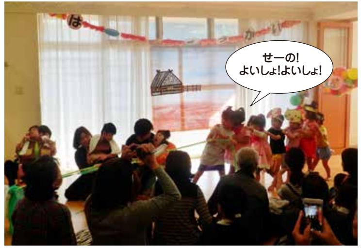
おペレッタ 大きなかぶ