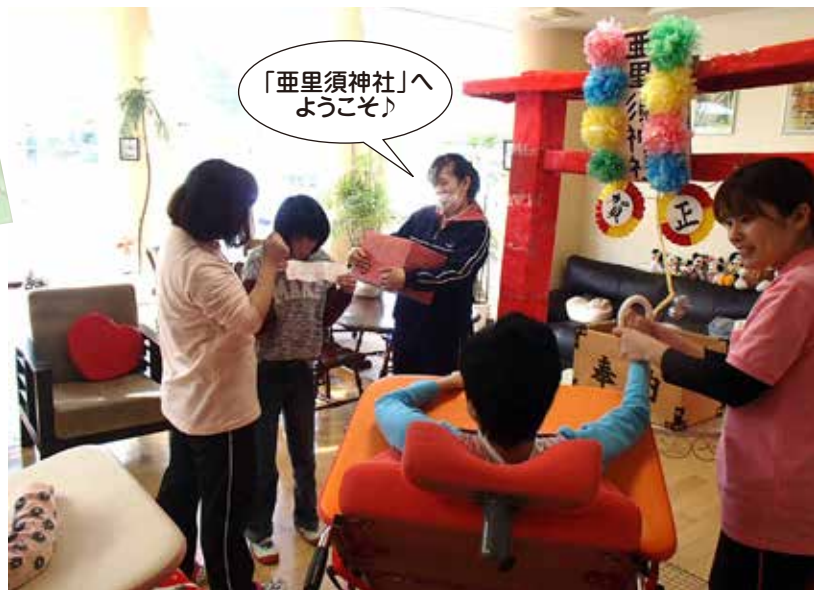
「垂里須神社」へようこそ♪