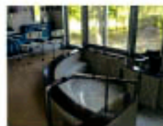
男性用浴槽です。皆さん外の庭園を見ながらゆっくりされています。

ご家族の方々より設備紹介のご要望の声がありましたので不定期ですがご紹介していきます。