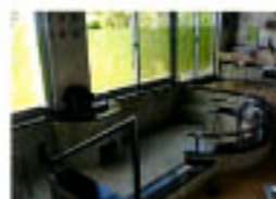
女性用浴槽です。外からは見えないように工夫しています。