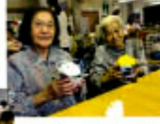
がんばってかわいい のが出来ました。