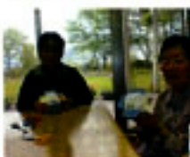
かわいい犬 になりました

5月10日の「母の日」と「季節の花」であるカーネーションにちなんだ作品を作りました。細かい作業があり目や手先が疲れたながらも、皆さん協力し合ってがんばられてました。苦勞して完成した作品を手にとられて「むげなあ〜」と笑顔が見られていました。