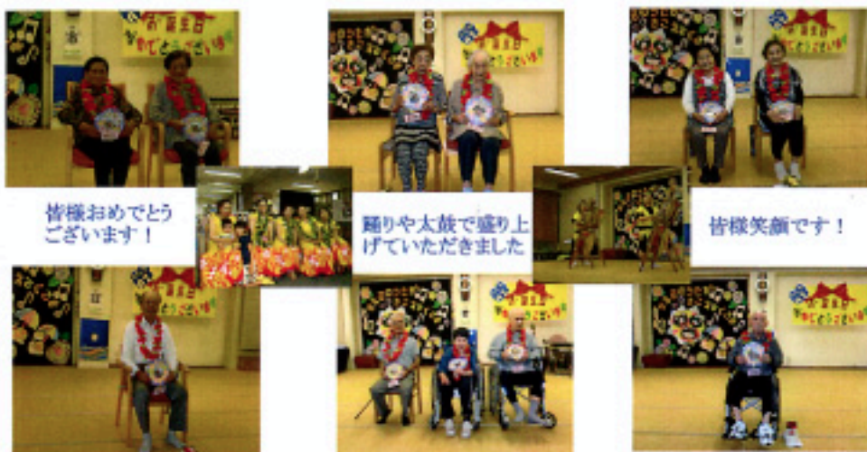
皆様おめでとう ございます！

4・5・6月生まれの方々への誕生会を開催いたしました。お一人お一人へ職員手作りの写真立てや記念品を贈呈させていただき、さらにはボランティアグループの皆様による踊りや歌を披露いただいた事でお祝いに一花添えていただきました。事情により参加いただけなかった方へは後日お祝いさせていただきます。お誕生日の皆様これからもお元気に過ごしていただきデイサービスへお越しください！