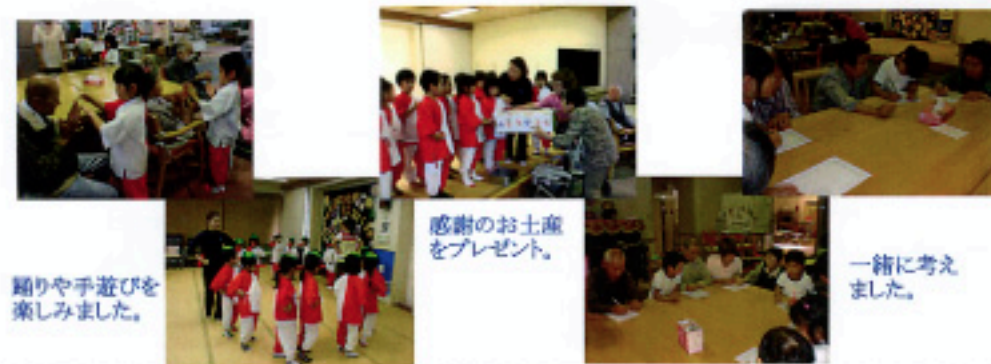
踊りや手遊びを 楽しみました。

元気な園児達がジメジメとした梅雨の空気を吹き飛ばしにデイサービスに来てくれました。歌や踊りの披露、一緒に物作りをしたりなど皆様の笑顔を引き出してくれました。御利用の方々は口々に「また来てね」と喜んでいらっしゃいました。