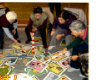
近くにあっても、早い倍勝です！