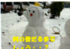
雪の雪だるまは しょう・？

愛泉園デイサービスセンター・生きがいデイサービス TEL 099-298-8331 FAX 099-298-7677