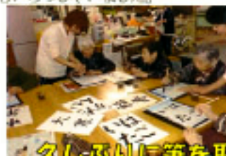
久しぶりに筆を取ったとは思えない達筆ぶりです。

書き初めとかるた取りを行いました。「筆はしばらく握ってみたい」と言われる方も多かったですが、練習してみるとやはり体が覚えていて、思い思いの文字をスラッと書かれていました。かるた取りは、いくつかのグループに分かれて行いましたが皆様白熱されて「暑い」と言われる方もいらっしゃいました。