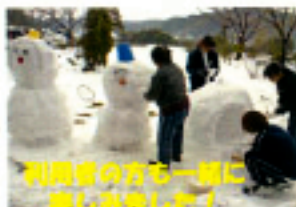
利用者の方も一緒に 楽しめました！

暖冬と言われていましたが、1月24～26日にかけてあたり一面銀世界でした。南国は雪に慣れない土地柄ですが、子供たちは大喜びで雪だるまや雪合戦など楽しんでいる姿も見られました。