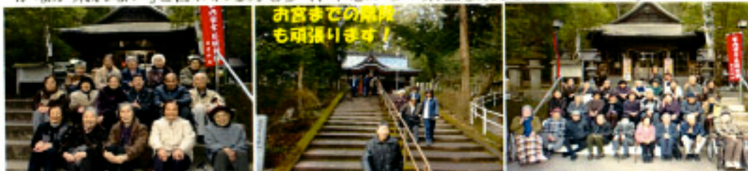
お宮までの階段 も頑張ります！

新年ということで花尾神社と徳重神社へ初詣に行きました。あいにくの天気と寒さでしたが、慣れ親しんだ花尾神社には「来たかったぁ！」と喜ばれ、伊集院の徳重神社では「なかなか来れない」と言われる方も多く、車窓からの景色も楽しまれていました。