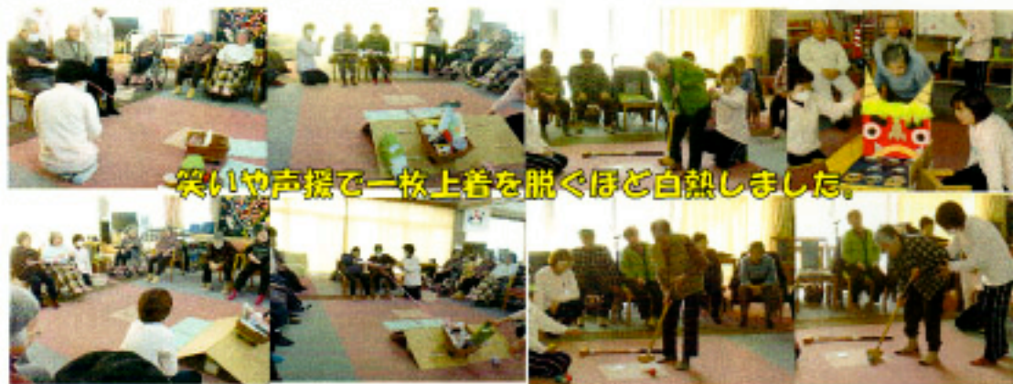
笑いや声援で一枚上着を脱ぐほど白熱しました。

室内でゲームを行いました。外の気温は寒かったですが、中は皆様「暑い」と口にされるなど勝負事になると白熱した雰囲気になりました。