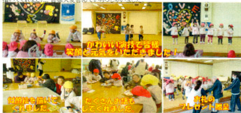
かわいい演技で皆様笑顔と元気をいただきました！

東侯幼稚園の園児達が皆様との触れ合いに来てくれました。歌やダンスなどでは手拍子が起るなど大変盛り上がりました。また、一緒に作品を作る時間では一人一人の似顔絵を一生懸命描いてくれました。皆様大変喜んでいらっしゃいました。