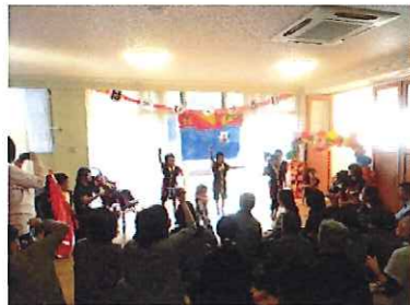
年長児～ソーラン節～

11/12(土)に療育発表会を開催いたしました。今年度より、新たな試みとして、年中・年長児を対象として行いました。緊張した様子も見られましたが、日々療育で行なっている活動をメインとした内容での発表会を実施しました。保護者の方々にも参加して頂きながら、子どもたち一人ひとりが主役となりつつ、お友達みんなで一つのことに向かって頑張り、仲間意識を高めるよい機会となりました。