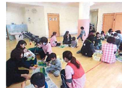
クリスマスリース 上手に出来るかな？