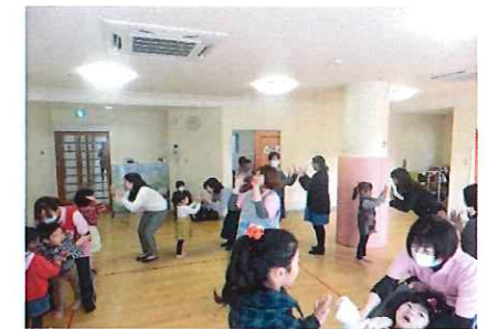
手をたたこう♪の音楽に合わせて 一緒にタッチ☆