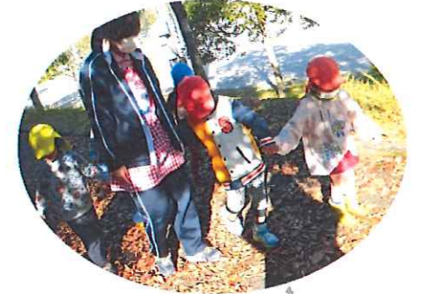
カサカサ音がするね！