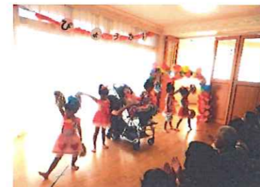
年中女児～プリキュア～