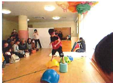
年中男児～サーキット～