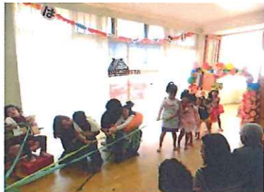
年中劇～大きなかぶ～