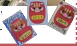
▶かわいい年賀状ができました