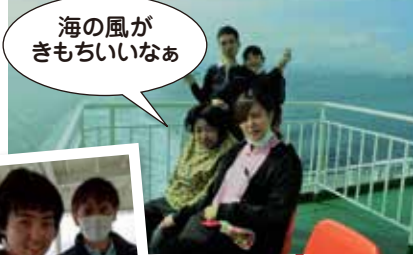
海風がきもちいいなあ