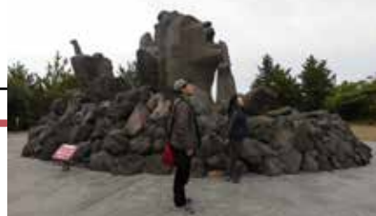
▲長淵剛のモニュメントと同じポーズで「うお〜!!」