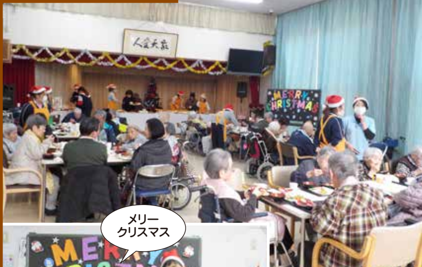
メリークリスマス