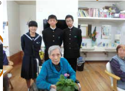
▶郡山中学校の皆さんと

郡山中学校の生徒さんから丹精込めて育てた花苗を愛泉園とふるさとの家郡山へいただきました。いつもありがとうございます。大切に育てます。