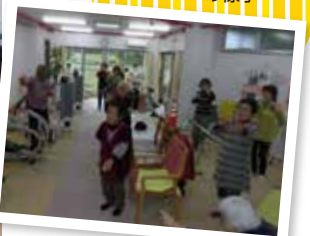
▼転倒 ストップ教室 の様子