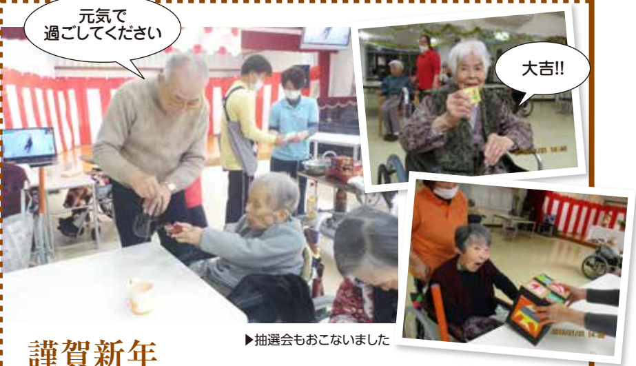
▶抽選会もおこないました