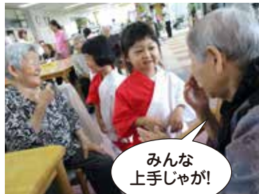
みんな 上手じゃが!