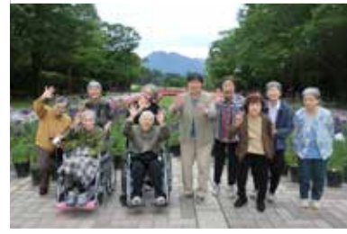
◀みんなでハイポーズ