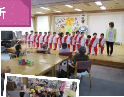
▲大きな声で こんにちは

6月の14日に郡山保育園、21日に東俣幼稚園の慰問がありました。元気いっぱいの踊りや共に行ったゲームなどで園児と触れ合うことでたくさんの元気をいただき、とても楽しい時間を過ごすことができました。