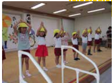
▲上手に 踊れました