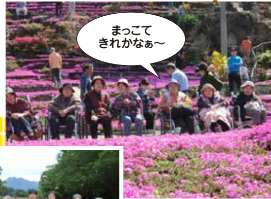
まっけてきれいなあ〜

梅雨の晴れ間に、「どこかいっが」と声が挙がったら、すぐにドライブ。芝桜や吉野公園の菖蒲などきれいな花々に気持ちがいいと大満足でした。