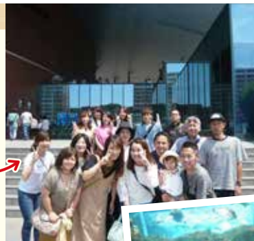
▲しものせき水族館「海響館」