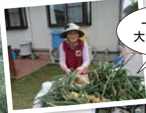
一つ一つが大きいでしょ〜