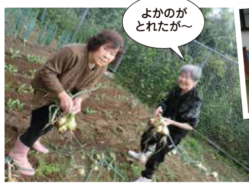
よかどがとれたが〜