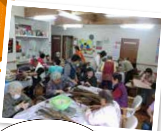
▲あく巻作りの様子

ホームでの行事に地域の方々を招いて、あく巻作りやフラワーアレンジをしました。フラワーアレンジは「よかどができた」と満面の笑みを浮かべていました。今後も地域の方々を招いて、入居者の皆様と一緒に何かできないか考えていきます。