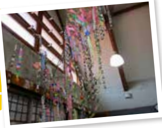
▲見事!完成! ※竹の長さは約7メートル!