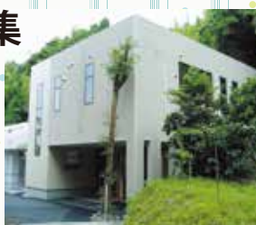
▲正栄会地域交流ボランティアセンター