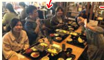
▲山口発祥の「瓦そば」