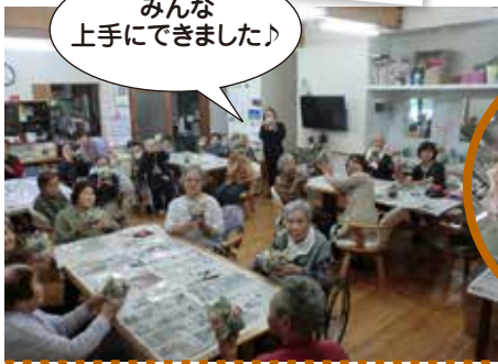
みんな上手にできました♪