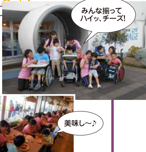
みんな揃って ハイッ、チーズ!

天気にも恵まれてデッキから飛行機が飛び立つ様子を間近で見ることができました。空港内のレストランでは、慣れない雰囲気緊張しつつも美味しさに「まだ食べたい!」とアピールする姿がありました。