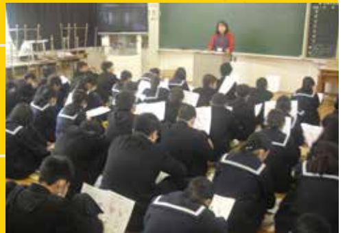
▲皆さん真剣に聞いてくださいました

昨年12月に郡山中学校の2年生に向けて、認知症サポーター養成講座を行いました。超高齢社会といわれる現在、身近な課題となった認知症について正しく理解し、手助けするのが認知症サポーターです。高齢者やご家族にとって、頼もしい協力者が増えていますね。