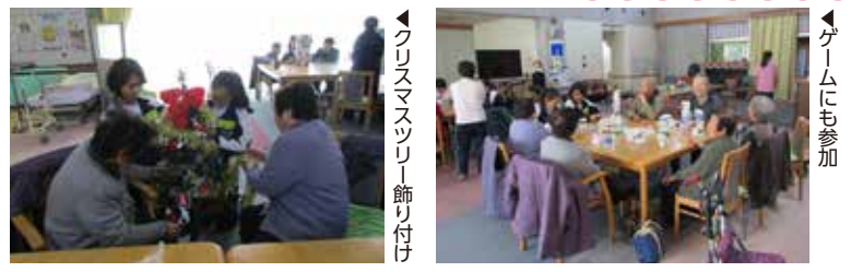
▲クリスマスツリー飾り付け