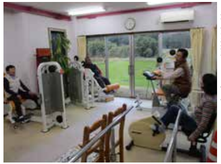
▲適度の運動でより健康に

介護予防や体を動かすことに興味のある方、誰でも参加ができます。デイサービスにある機能訓練室を地域の皆様に活用していただいております。