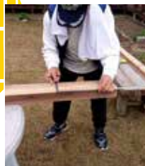
▲ベンチ作っています