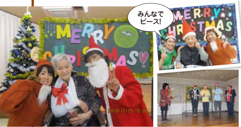
▲サンタと一緒に ▲ともしびのつどい

12月25日にクリスマス会を開き、ともしびのつどいや昼食会、写真撮影など行いました。昼食会では、クリスマス特別オードブルを笑顔いっぱい家族の皆様と食べました。クリスマスプレゼントをお一人おひとりにお渡しすると「ありがとうね～」と皆様喜ばれていました。