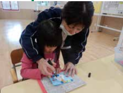
▲ネズミの顔を描きます

道具の使い方と手指の動きを高める事を目的として、年賀状制作を行いました。型紙で枠取りした部分にちぎった色紙を貼り、スタンプで飾り付けを行いました。最後にコメントを書き出来上がりです。子どもたちは、色紙が枠からはみ出さないように、そして隙間なく貼れるよう慎重に行っていました。また、文字のバランスに気をつけながら見本をよく見て集中して取り組み、一人一人オリジナルの作品が完成しました。