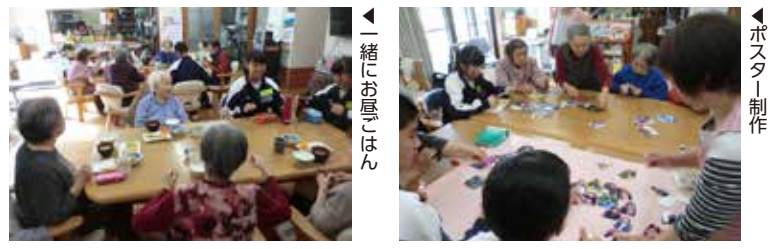
▲一緒にお昼ごはん