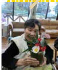
▲正月用にフラワーアレンジ