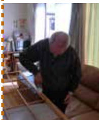
▲障子の張り替え上手です