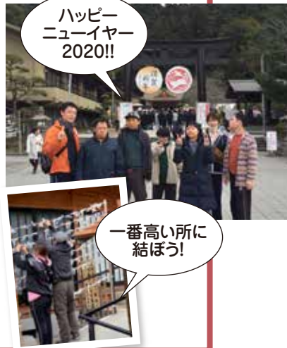
ハッピー ニューイヤー 2020!!

新年の祈願のために護国神社へお出かけしました。大勢の人が訪れていたなか、参拝やおみくじを引き初詣の雰囲気存分に体験することが出来ました。今年は「オリンピックイヤー!!」その熱気にあやかり、アミュザントIIも皆様と一緒にたくさんの思い出を作り活気あふれる一年にしたいと思えます。