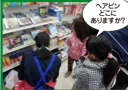
ヘアピン どこに ありますか?

学習課題の一環として年中児クラスでお買い物へ出かけました。お母様に頼まれたリストを手にお買い物スタート!店員さんに場所を尋ねたり、自分でお金を渡しお釣りを受け取るなどの体験ができました。また、「お店の中で走らない」「順番に並んで待つ」などの約束事も守ることができ、公共のマナーを学ぶ良い機会となりました。