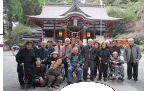
▲みんなで記念写真