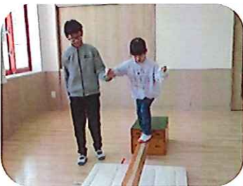
ゆっくりでいいからね！

ペアのお友達と協力して、サーキット遊びをしました。難しいコースがあり相手が困っていた時は、ペアの子が手を差し伸べたり、「頑張れ。」「あと少し！」等、応援する姿が見られました。繰り返していくうちに、自主的に相手を思いやる姿が多く見られました。