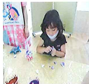
なかなか色がつかないよ～！