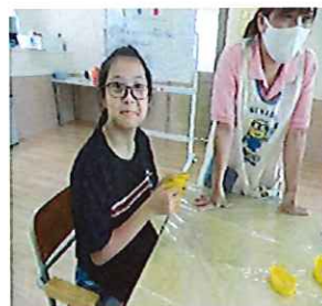
バナナ美味しそう！