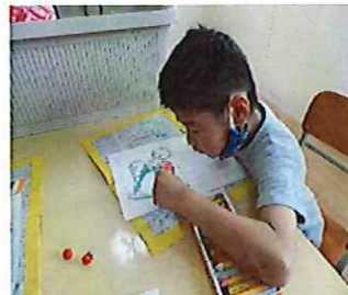
はみ出さないように！