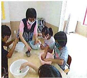
☆さらさらしてるね☆