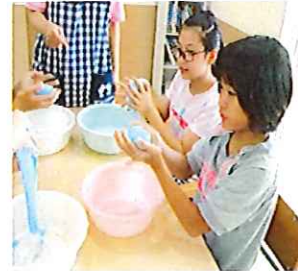
ボールが出来たよ！