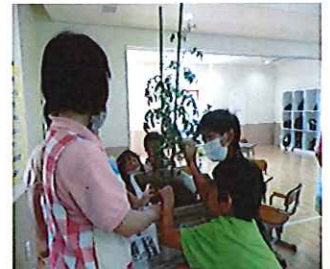
トマトがいっぱい！