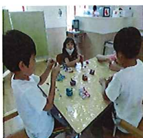
葉っぱの形はこうかな。