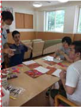
▲作り方を皆で確認