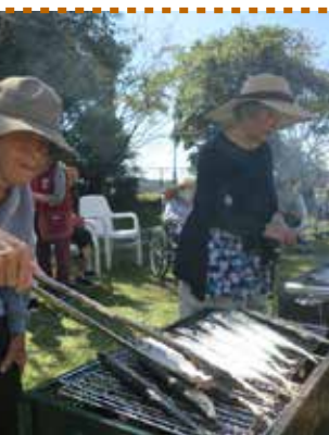
▲焼き加減は任せて