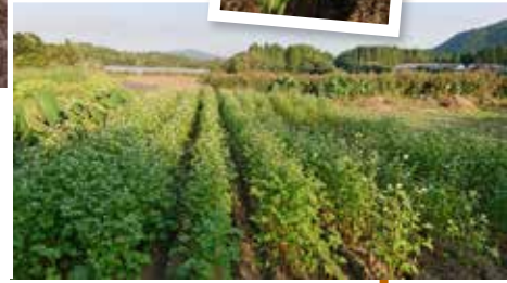
▲蕎麦は鑑賞でもきれいです