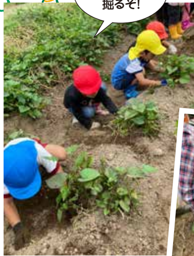
よーし! 大きいお芋掘るぞ!

グループホームの畑でお芋掘りを体験しました。グループホームの利用者の皆様に掘り方や抜き方を優しく丁寧に教えていただきながら、「よいしょ、よいしょ!」と一生懸命掘っていた子ども達。様々な形や大きさのお芋に驚くとともに、食への興味関心を深め収穫の喜びを味わうことができました。