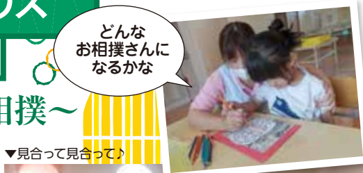
▼見合って見合って!

10月1日の十五夜の日「トントン相撲」を行いました。まず、子どもたちでお相撲さん作りに取り組み、色をつけたり表情を描いていく事で力強いお相撲さんが完成しました。さあ、いざ対決!!「いけいけー!」「頑張れ負けるなー!」とあちらこちらで歓声が上がり、十五夜の季節を感じながら楽しく過ごす事が出来ました。