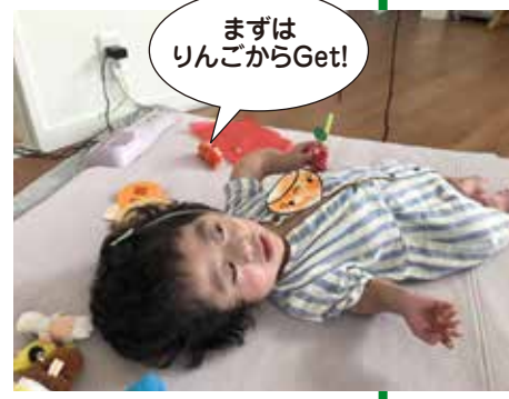
まずはりんごからGet!

秋の製作課題として「季節の実を作って収穫しよう」を行いました。シール貼りやローラーでの色塗りは、「自分でやりたい!」という気持ちを全身で表現していました。また、感触が苦手なりのり付けにも意欲的に取り組み、かわいらしいどんぐりや栗、りんごが完成しました。上から吊るした実をしっかりと見て、いっぱい手を伸ばしGet!全部収穫し、達成感に満ち溢れた笑顔を見せてくれました。