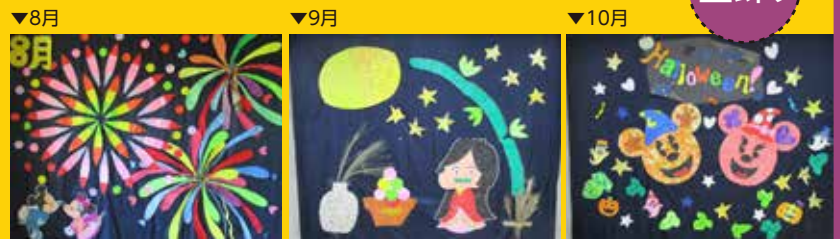
8月 真夏に咲く火花 9月 十五夜お月様 10月 ハッピー・ハロウィン