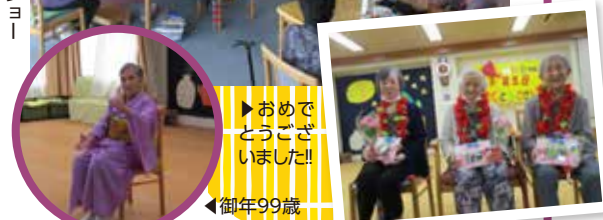
▶おめでとうございました!