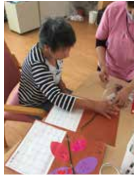
▲しっかり貼りましょう!