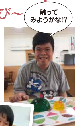
触って みようかな!?