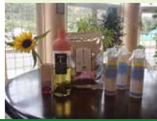
▲お手が出てきた!もう少しだ!