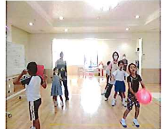
皆で力を合わせて！！