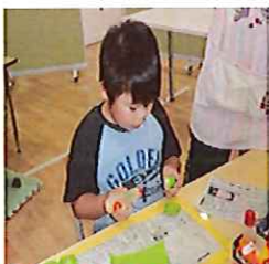
新聞紙が見えないように。のりで止めて！