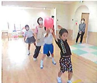
落とさないように！