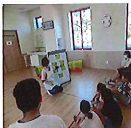
もういいよって言ってね！