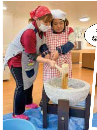
◀力を合わせてペタンペタン!