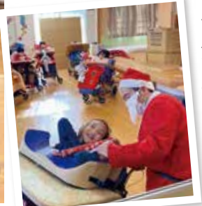
▲プレゼントゲット!!