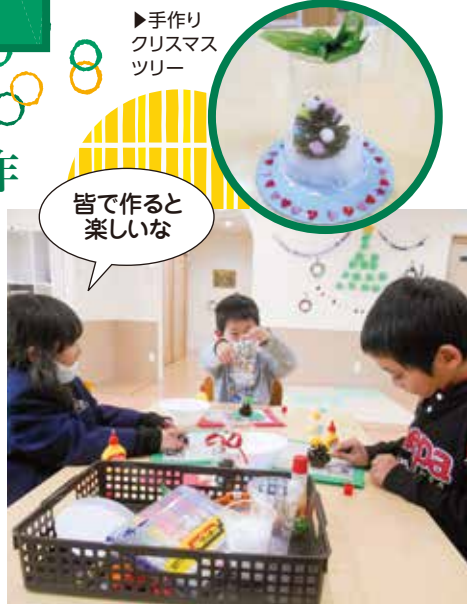
皆で作ると楽しいな

クリスマスを心待ちにしている子どもたち、素材に合わせて道具を使い分けながら思い思いの作品を作っていました。「星の飾り取って!」「ペン貸して!」と児童同士で物の貸し借りも上手に出来ていました。活動の終わりには制作した感想を発表してもらい「カップをかぶせるのが難しかったけど頑張りました。」「リボンを付けるのが楽しかったです。」といった意見を伝え合う事が出来ました。