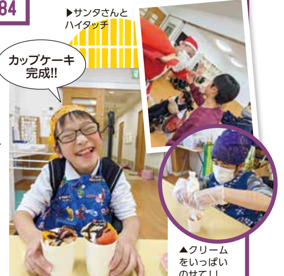
▲クリームをいっぱいつけて!!