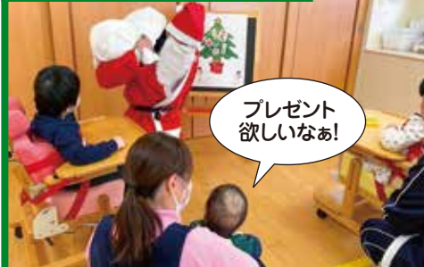
プレゼント欲しいなあ!

サンタクロースと一緒に「クリスマスパネルシアター」遊びを行いました。行事に興味を持ちお友達や保育士とのやりとりを楽しめるよう、言葉かけや雰囲気づくりを工夫した事で、子ども達の表情の変化やプレゼントに手を伸ばす姿など自発的な動きを引き出す事が出来ました。