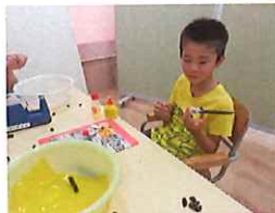
模様はしましまだよ！