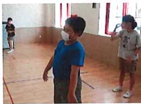
落とさないように…