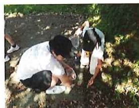
どんぐりみ～つけた！