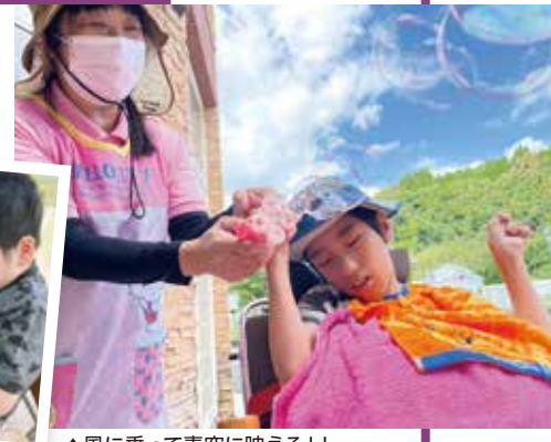
▲風に乗って青空に映える!!