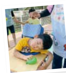
▲この角度で見ると～!