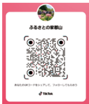
▶QRコードから登録できます

日頃の生活を動画配信しています。200万再生している動画もありますので、ぜひ登録をお願いいたします。