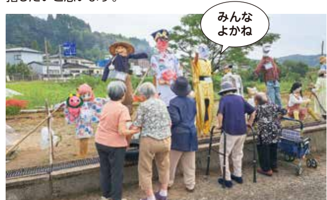
▲来年は優勝目指します

地域行事への参加を目的として、案山子コンクールへ出展しました。なんと!!準優勝をいただきました。来年は優勝を目指したいと思います。