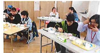
皆でいただきます♡