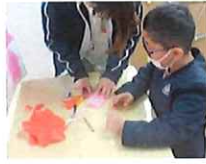
ここを切るんだね♪

折り紙で梅の花作りを集中して取り組みました。見本を見て丁寧に沢山作りしました。木の幹は折り紙をちぎって貼り、皆で一つの梅の木を完成させました♪