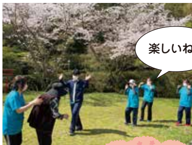
▲みんなで踊りました