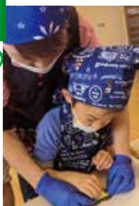
▲感謝の気持ちを込めてベッタンコ!