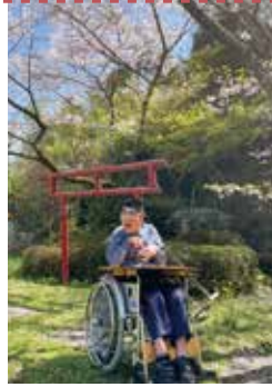
▲愛泉園の中庭でパシャリ