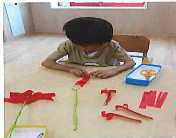
きれいにできるかな？