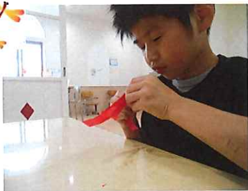
テープをそっと剥がして...