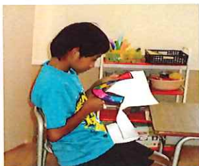
丁寧に切ってるよ！