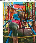
ヨイショヨイショ～😊