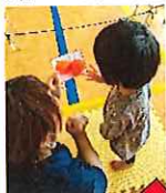
これどこにあるかな～

果物・動物のカードを使い、身体を使った遊びに取り組みながら指示されたカードを選び「同じですか?」とみんなに尋ね…「同じです!」と返答されると、嬉しそうに手をたたいて喜ぶ子ども達でした(´ω`*)