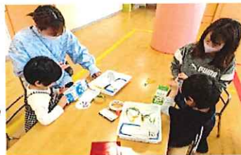
どんな車にしようかな～😄