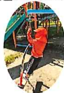
バランス取れてるでしょ♪

粗大運動(体を大きく使った運動)を通してのびのびと楽しむこと、また公共施設でのマナーを知ることが目的として、小野公園へ行きました。雨の合間の晴れた日だったので子ども達も嬉しさを全身で伝えてくれました♡公園で遊ぶ中で、友達同士で名前を呼び合い、一緒に遊ぶ姿もみられ、充実した時間を過ごしました\(^o^)/