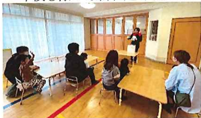
牛乳パックでLet's!マジック!