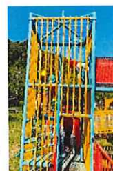
みんなで登ったよ☆