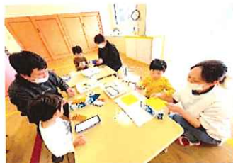
かっこいい車を作るぞ～☆