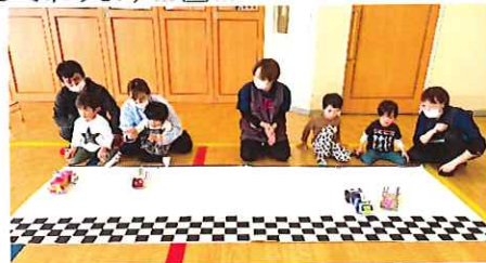
はしるの、はやいぞ～!ビュン🚗