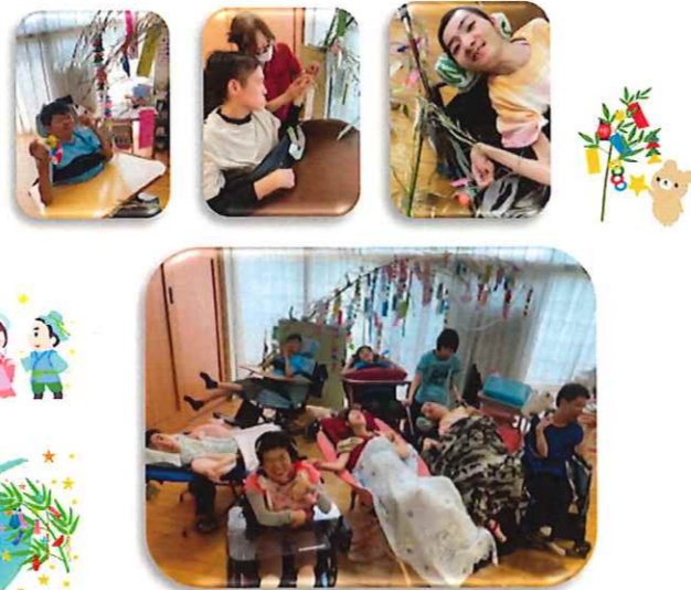
みんな仲良くハイ！チーズ!!(*^^)v

夏の風物詩七夕♪今年も色とりどりの笹飾りを作り、みんなで飾りました！とてもきれいな笹飾りができ、室内がにぎやかになりました(#^^#)