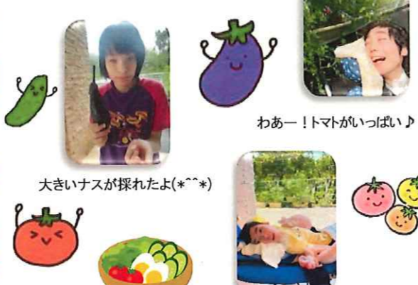
わあー！トマトがいっぱい♪

ぐんぐん背が伸びて大きく育ち、ずっしり重たいきゅうりやナス☆ トマトも真っ赤に色付きました(*^^)v