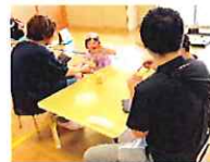
アイス美味しいね♡