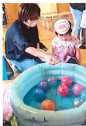
ヨーヨーとスーパーボールGET!(^_^)!