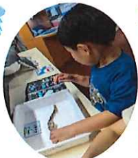
サメの皮を触ろう~