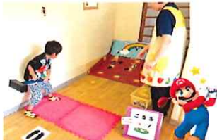
ホールインワンを目指して...