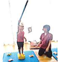
おかしを釣ったぞ~☆