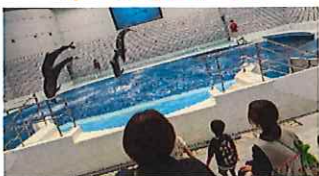
イルカのジャンプ♪