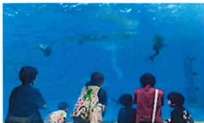
大水槽のお掃除タイムに遭遇(。)