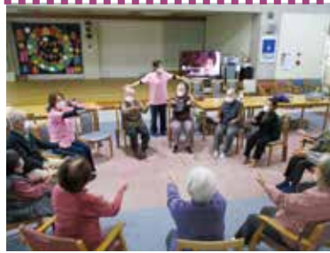
▲準備運動は念入り！