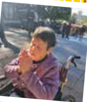
▲元気であ りますように