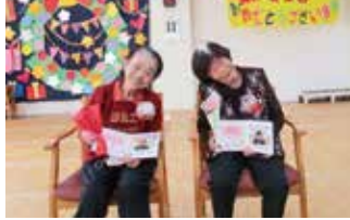
▲とびきりの笑顔です♡