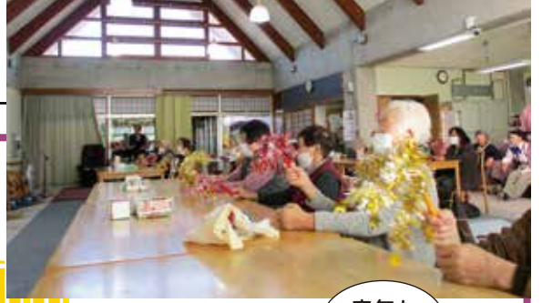
▲皆様、ソリソリです！