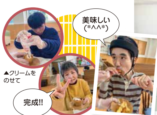
▲クリームを のせて