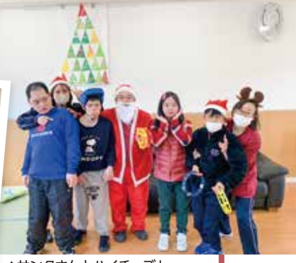
▲サンタさんとハイチーズ!