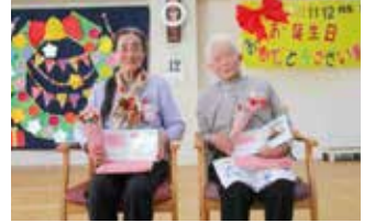
▲お二人とも輝いています！