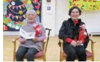
▲バックのリースも賑やか