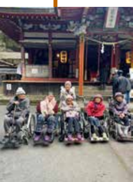
▶おみくじの 結果は…笑顔

新年を迎えたので、神社へ初詣に出かけ ました。おみくじを引いてみると、内容はそ れぞれ異なりましたが、皆様の表情に は楽しみと期待が満ちていました。清々し い気持ちで一年過ごしていきましょう。