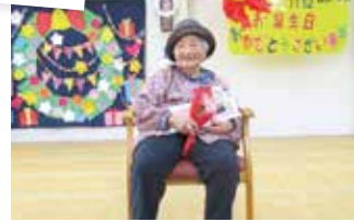
▲お一人でも「華」がありますね