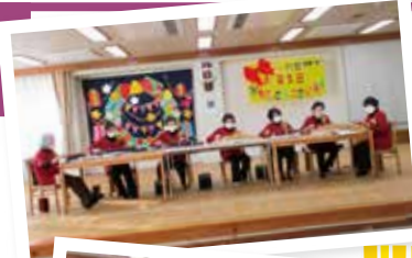
▲美しい大正琴の 音色ですね