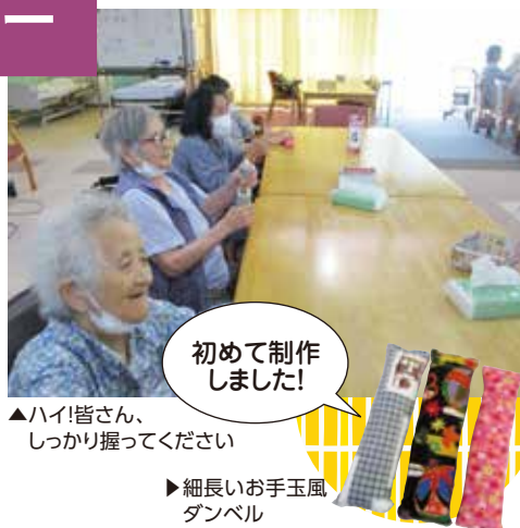
▲ハイ!皆さん、しっかり握ってください