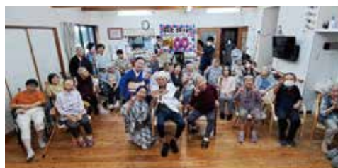
▲皆さんで記念撮影

入居者様の100歳のお祝いとして、ささやかながら祝賀の会を開催しました。田郷流郡山会の皆様が華やかな踊りを披露してくださり、会場は笑顔と拍手に包まれて和やかな時間を過ごせました。ありがとうございました。