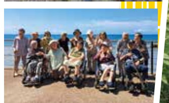
▲きれいな景色でした