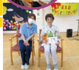
▲職員とハイチーズ📷