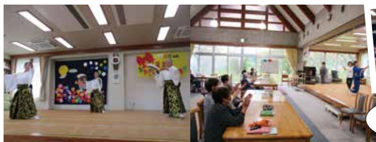
▲歌や踊り、三味線と、盛り沢山の内容で楽しませていただきました