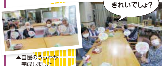
▲自慢のうちわが完成しました