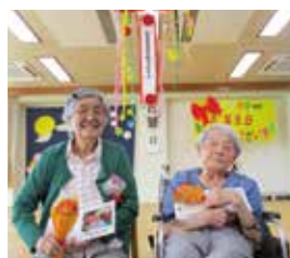
▲恒例のくす玉も割っておめでたい!