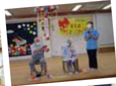
▲お誕生日おめでとうございます