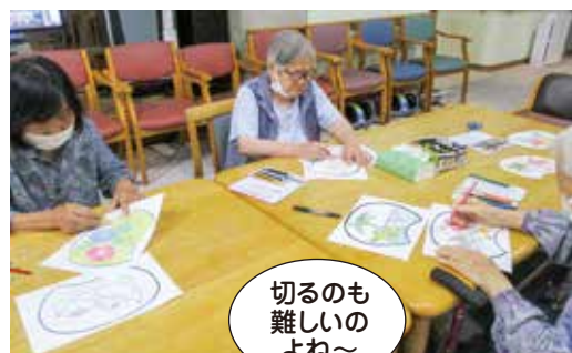
▲皆様、真剣な表情です!

連日の猛暑で気が滅入りそうな日々、この暑さを吹き飛ばすべく、涼しげなうちわを作りました。好きなデザインを選び色を塗ったり夏らしいシールで飾り付けしたりと、思い思いのうちわ作りを楽しんでいました。ご自分だけの特別なうちわに満足され、「早速家で使ってみます」との声が聞かれました。