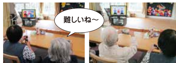
▲細かい動きにもチャレンジ! ▲指先に力をいれてつまみますよ!