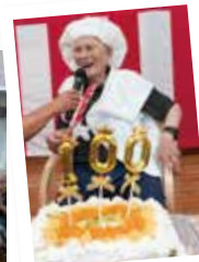
▲おめでとうございます