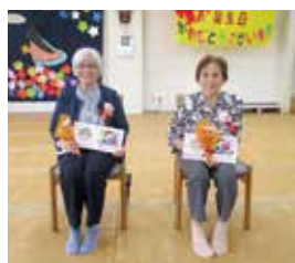
▲舞台の上は毎年、緊張するわ!

7・8・9月生まれの方々の誕生会を開催しました。皆様様に緊張した表情でしたが壇上で感謝の言葉などしっかり挨拶されていました。また、今回も沢山のボランティアの方々や歌や踊りなどで誕生会に華を添えていただき大盛況でした。ボランティアの皆様、ありがとうございました。