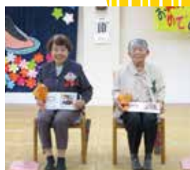
▲来年も元気に仲良く歳を重ねましょうね♡