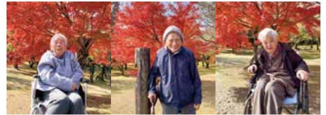
▲98歳・100歳・101歳 皆さん喜んでくださいました

11月から12月にかけて、いろんなところへドライブに出かけました。特に県青少年研修センターの赤く色づいた「かえで」はとてもきれいでした。今後も計画していきます。