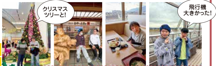
クリスマスツリーと!

利用者様に人気の外出活動!今回はイオンモール始良と鹿児島空港へ行きました。イオンではフードコートで好きなメニューを選び美味しく食べていました。鹿児島空港では飛行機が飛ぶ瞬間や座席に座る体験もできて大満足の1日でした。