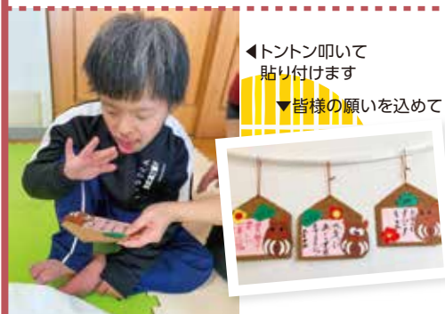
◀トントン叩いて貼り付けます

色とりどりのペンや飾りを手で、自分だけのオリジナル絵馬作りに挑戦!!思いの願い事を書き入れ個性豊かな絵馬が完成しました。今年も皆様にとって素晴らしい一年となりますように!