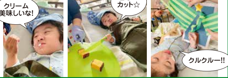
クリーム美味しいな!

季節の行事を知ることや自分の手で作る過程を通して興味の幅を広げることを目的に、クリスマスにちなんだクッキングと制作を行いました。クッキングでは包丁をしっかりと握ってカステラを切ったり、チョコをトッピングしたり♡途中、クリームの感触を手や口で確かめたい気持ち溢れていました!!制作では、細かい両面テープを全部自分で剥がし、決めた位置の一つひとつ貼り付けて、綺麗なツリーが完成!!自分で作ったケーキとツリーを前に、達成感・満足感いっぱいの笑顔がみられました。