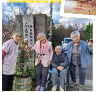
▶細かい作業頑張ってます

年末には、新しい年を迎えるために、門松や正月飾り一つひとつ手作りしながら、「良い一年になりますように」という願いを込めて準備を進めていきました。迎えたお正月には、初詣へ出かけました。健康を願う人、家族の幸せを思う人など、手を合わせる姿はさまざまでしたが、新しい一年を大切に過ごしたいという思いは皆様同じように感じられました。