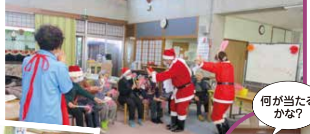
▼二人のサンタクロースに笑顔!