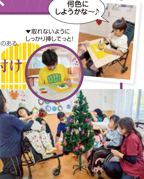
何色にしようかな〜!

12月は行事活動でクリスマス制作と飾り付けを行いました。制作活動では紙粘土をツリーの形にしていき、その上からストローや綿棒を使って花紙を紙粘土に挿し入れていきました。形も色も違う個性豊かなツリーがいっぱいできました。クリスマスツリーの飾り付けでは子どもたちに好きな飾りを選んでもらい、一つずつ丁寧に掛けていながら季節の行事を楽しみました。